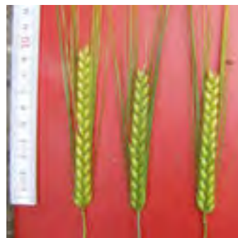
Plonowanie (średnia BSA 2008-2012 skala 9 pkt.)