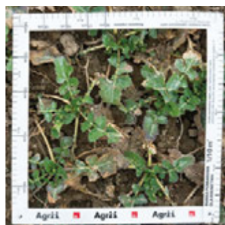
Obsada, 17.03.2017 r.