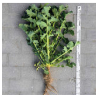
Pokrój rośliny, 19.04.2017 r.