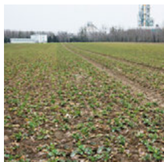
Stan plantacji, 17.03.2017 r.