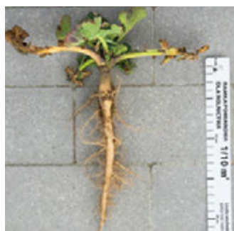
Pokrój rośliny 17.03.2017 r.