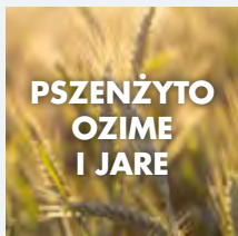
PSZENŻYTO OZIME I JARE