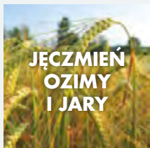
JĘCZMIĘŃ OZIMY I JARY

(związek z grupy fenoksykwasów - w postaci soli dimetyloaminowej)