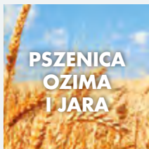
PSZENICA OZIMA I JARA